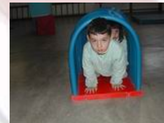
Aula de psicomotricitat